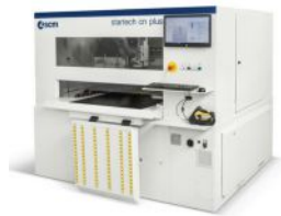
Centre de perçage et de rainurage SCM STARTECH CN PLUS AB/00017147