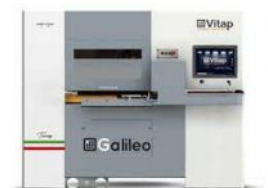
CENTRE DE TRAVAIL à commande numérique VITAP Type GALILEO 3 N° 220375/E