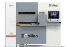
CENTRE DE TRAVAIL à commande numérique VITAP Type GALILEO 3 N° 220357/D