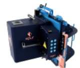
Robot de Taille de Charpente EPUR OAKBOT V4.2.2 N°220013