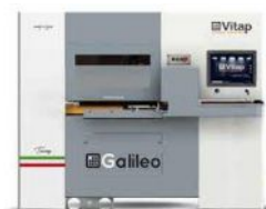
CENTRE DE TRAVAIL à commande numérique VITAP Type GALILEO 3 N° 220374/E