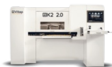
CENTRE D'USINAGE A COMMANDE NUMERIQUE 3 AXES VITAP Type K2.2 N° 220385/AM