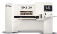
CENTRE D'USINAGE A COMMANDE NUMERIQUE 3 AXES VITAP Type K2.2 N° 220378/AL