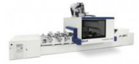
Centre d'Usinage Morbidelli SCM M200 CNC N° AA10003838