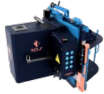
Robot de Taille de Charpente EPUR OAKBOT V4.2.2 N°2200018