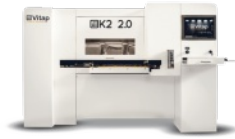
CENTRE D'USINAGE A COMMANDE NUMERIQUE 3 AXES VITAP Type K2.2 N° 220421/AN