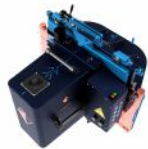
Robot de Taille de Charpente EPUR OAKBOT V4.2.2 N°220006