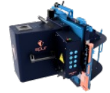
Robot de Taille de Charpente EPUR OAKBOT V4.2.2 N°220008