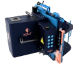
Robot de Taille de Charpente EPUR OAKBOT V4.2.2 N°220007