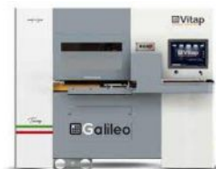
CENTRE DE TRAVAIL à commande numérique VITAP Type GALILEO 3 N° 220318/C