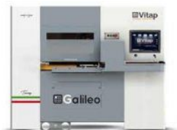
CENTRE DE TRAVAIL à commande numérique VITAP Type GALILEO 3 N° 220317/C