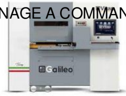
CENTRE DE TRAVAIL à commande numérique VITAP Type GALILEO 3 N°220476/F