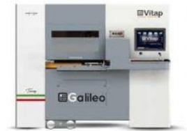
CENTRE DE TRAVAIL à commande numérique VITAP Type GALILEO 3 N° 120724/C