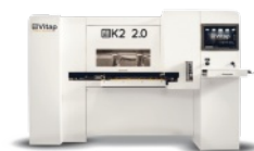
CENTRE D'USINAGE A COMMANDE NUMERIQUE 3 AXES VITAP Type K2.2 N° 220386/AM