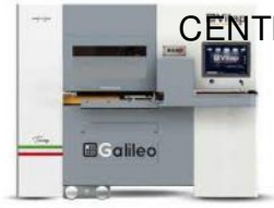
CENTRE DE TRAVAIL à commande numérique VITAP Type GALILEO 3 N°220475/F