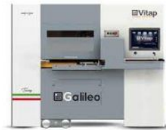
CENTRE DE TRAVAIL à commande numérique VITAP Type GALILEO 3 N° 120526/A