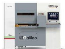
CENTRE DE TRAVAIL à commande numérique VITAP Type GALILEO 3 N° 220358/D