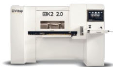
CENTRE D'USINAGE A COMMANDE NUMERIQUE 3 AXES VITAP Type K2.2 N° 120490/AF